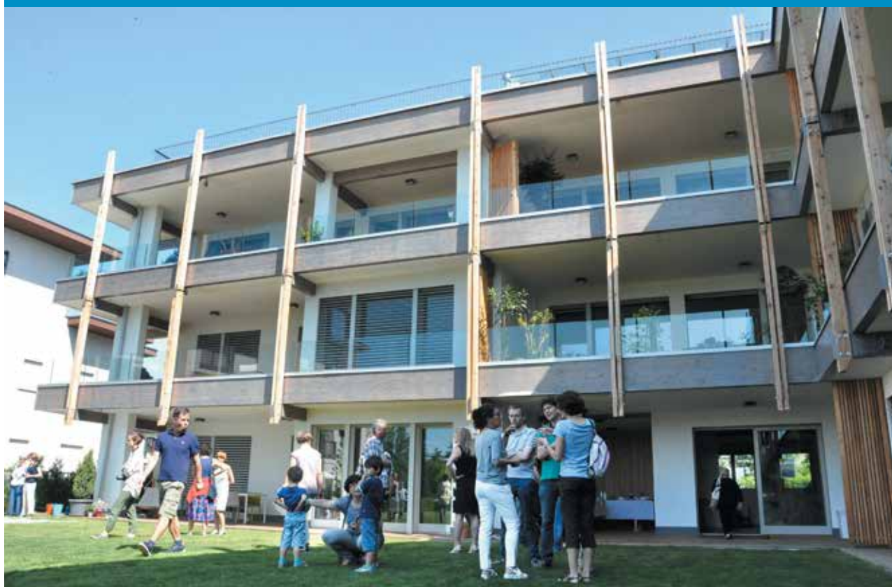
Il giardino della Corte dei Girasoli il primo esperimento di cohousing in via Fiume 4 a Vimercate.