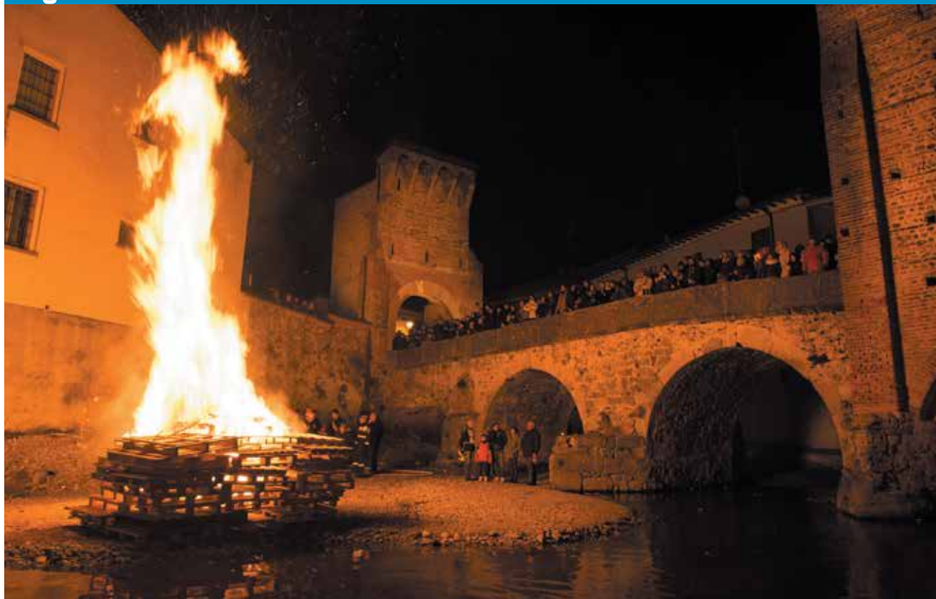
Nella foto il falò sul greto del torrente.